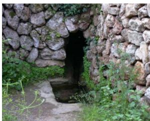
Font de Ses Mentides

Posteriorment (després d'haver deixat una caseta a l'esquerra) arribarem a la Possessió Son Coll, construïda en el segle XIII des d'on podem gaudir d'una vista privilegiada. Avui en dia el casal segueix amb el seu caràcter ancestral, , des del segle XIX es va anar dividint la propietat arribant a sorgir un petit nucli de cases amb distints propietaris, una d'elles adquirides pel famós Robert Graves.