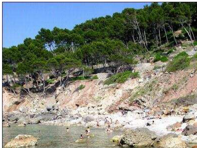
CALA ES CANYERET A LLUCALCARI