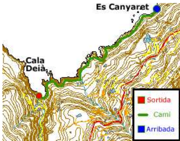
Mapa 4a: Cala Deià-Llucalcari